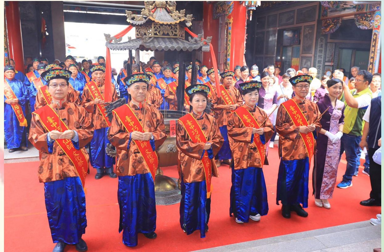
巧聖仙師誕辰～歷史上首位女總主祭官